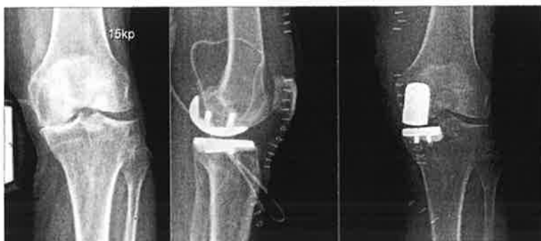
Abb. 1: Schmerzhafte Varusgonarthrose bei einer 72-jährigen Patientin a) präoperativ, b) postoperativ a.p., c) postoperativ zeitlich

dische Chirurgen mit einer großen Anzahl an operierten Teilschlittenprothesen erreichen die ideale Positionierung der Prothesen in den meisten der operierten Fälle – einige wenige Patienten werden aber dennoch nur suboptimal operativ versorgt. Als logische Konsequenz einer kontinuierlichen Verbesserung von Operationstechniken, Implantaten und Instrumenten und unter Verwendung der schon seit Jahren etablierten Operationsform der Computernavigation steht den orthopädischen Chirurgen im Evangelischen Krankenhaus Wien Währing – als erstem Krankenhaus im Osten Österreichs – seit Kurzem ein Verfahren zur Verfügung, bei dem die computerunterstützte Navigationstechnik auch für Knie teilschlittenprothesen für isolierte Gelenksschäden an der Innen- oder Außenseite des Gelenkes zum Einsatz kommt. Dieses neuartige System vereint das schon seit Jahrzehnten erfolgreich angewendete Verfahren der Computernaviga-