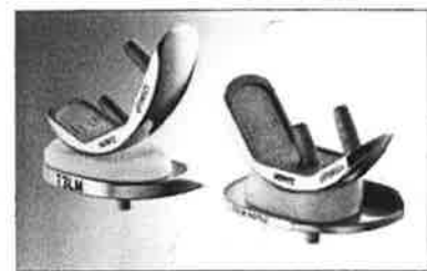
Abb. 2: Univation® X-Implantatsystem, Fixed Bearing und Mobile Bearing